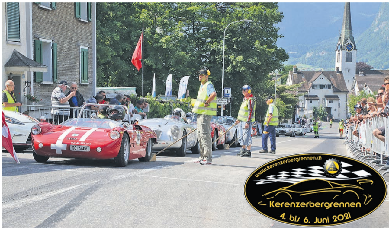
Die Fahrer der historischen Rennfahrzeuge werden am Samstag, 5., und Sonntag, 6. Juni 2021, ihre Motoren am Start beim Restaurant Waid in Mollis wieder dröhnen lassen.

Der Gemeinderat Glarus Nord hat einer weiteren Durchführung des Kerenzerbergrennens zugestimmt. Das Bergrennen findet vom Freitag, 4., bis Sonntag, 6. Juni 2021, statt. Am Freitagabend startet die Veranstaltung mit dem Race-Dinner im Fahrerlagerzelt. Der eigentliche Rennbetrieb auf den «Kerenzer» findet am Samstag und am Sonntag statt. Die historischen Rennfahrzeuge können im zugänglichen Fahrerlager besichtigt werden.